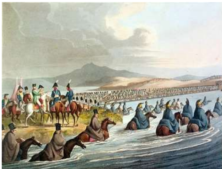
Переправа Великой Армии через Неман, 1812

Французский император Наполеон Бонапарт стремился покорить всю Европу. Одну за другой он завоёвывал европейские страны. Для полного господства Наполеону оставалось победить Россию. В его распоряжении были войска почти всей покорённой Европы – более 600 тысяч человек и 1700 орудий. В ночь на 12 июня 1812 года Наполеон вторгся в Россию. Он намеревался дать генеральное сражение, разгромить русские войска и на этом закончить войну.